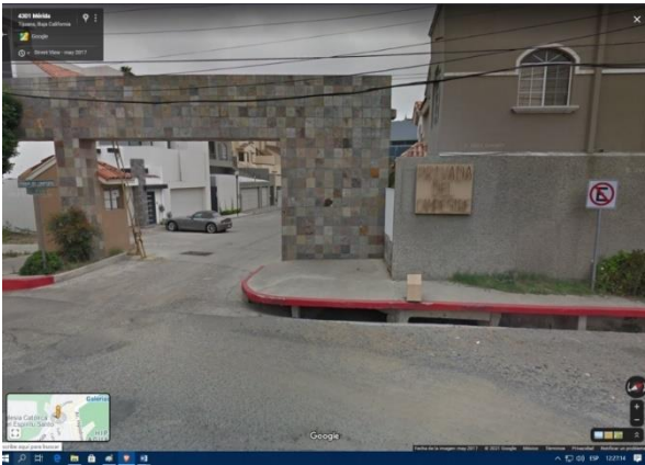
Imagen obtenida a través de la herramienta digital de Google Maps. Se puede observar la Calle Mérida a la altura de la Privada Campestre, apreciándose que la banqueta funciona, además, como un sistema pluvial denominado boca de tormenta.

72 La alcantarilla denominada “boca de tormenta” se encuentra ubicada a las afueras de la Privada Campestre en la colonia Hipódromo de esta municipalidad. En la inspección realizada el 21 de diciembre de 2021 por personal adscrito a este Organismo Estatal, se hizo constar que no contaba con rejillas de protección, asimismo, de la búsqueda de información en los distintos portales de noticias, se obtuvieron fotografías tomadas el día de los hechos, en los que se aprecia la corriente de agua y la boca de tormenta sin rejillas de protección.