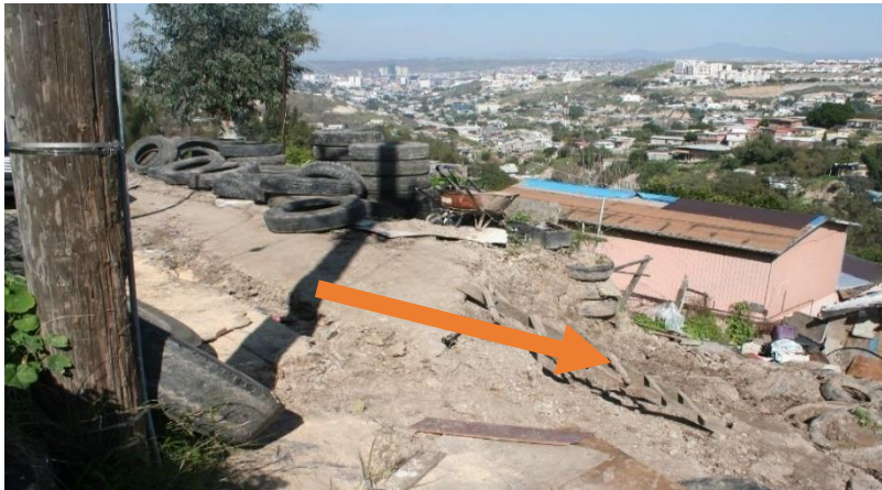
Imagen en la que se observa una pendiente descendiente o ladera, con llantas y escombros, que van desde la parte superior hasta la parte más baja de la ladera, la cual colinda con dos viviendas.

105. De la declaración de las víctimas, V6 y V7 , la inspección realizada por personal de este Organismo Estatal, así como las documentales que obran en la carpeta de investigación 3, se advierte que un particular realizó movimientos de tierra y la construcción de un muro con llantas, lo cual, en conjunto con factores como el tipo de suelo, el reblandecimiento por la filtración de agua y la falta de un sistema pluvial, entre otros, provocaron el deslizamiento del terreno de la parte superior de la casa donde vivían las víctimas, sobre el cual descansaba el muro de llantas, como se muestra en la siguiente imagen.