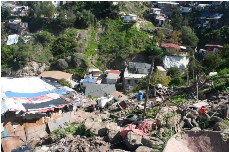
Imagen obtenida derivada de la inspección ocular realizada por personal de la CEDHBC.

[...] no existe infraestructura vial, soluciones pluviales, hay falta de equipamiento urbano, no hay un ordenamiento de edificaciones o regulación sobre los límites de niveles permitidos por vivienda, pasos de servicios, ya que las viviendas de las zonas más altas de los taludes generan un efecto dominó afectando sus acciones a los vecinos de las partes más bajas, así como falta de mantenimiento en los servicios de agua, drenaje y postes de CFE que presentan inclinaciones ante los deslizamientos [...]